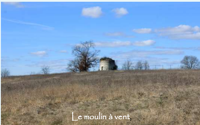
Le moulin à vent,

Sur le riant côteau, de la terre occitane, Parmi les genévriers où les choses ont une âme, Point où le Dieu du vent danse ses tarentelles, Abandonné, seulet, le moulin prend ses ailes.