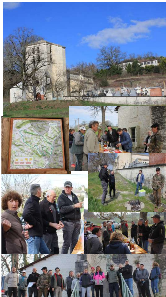
ouverture du chemin de randonnée, mars 2021

Les choses ont bien changé, il n'y a plus de courses, plus de curé... mais toujours la fête, et une belle fête !